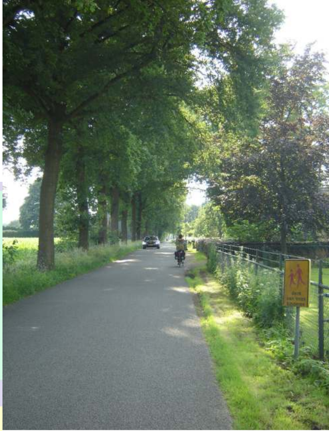
De Hanendorperweg richting Sportpark en campings

De Hanendorperweg is de aanrijroute van het toeristisch verkeer richting de vele campings en de route die moet worden genomen richting Sportpark "het Hanendarp". Voor de fietsende jeugd is het een onveilige route. Er wordt hard gereden en de weg is plaatselijk uitermate smal met drassige en slechte bermen en omhoog groeiende wortels van de bomen. In de wintermaanden is het er erg donker door de weinige straatverlichting. Onderzocht zal moeten worden of hier een vrij fietspad kan worden aangelegd of eventueel fietsstroken. Meer straatverlichting is ook aan te bevelen. Deze verkeersproblemen spelen al lange tijd bij de Voetbalvereniging Ernst en het is dan ook noodzakelijk deze problematiek zo snel mogelijk op te lossen.