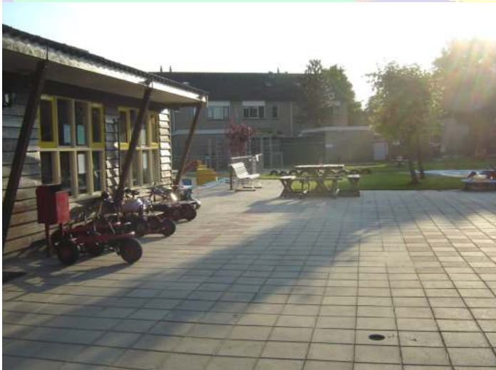
Speeltuin Ds.v. Rhijnstraat

Meer contact met de wijkagent is een grote wens van de inwoners van Emst.