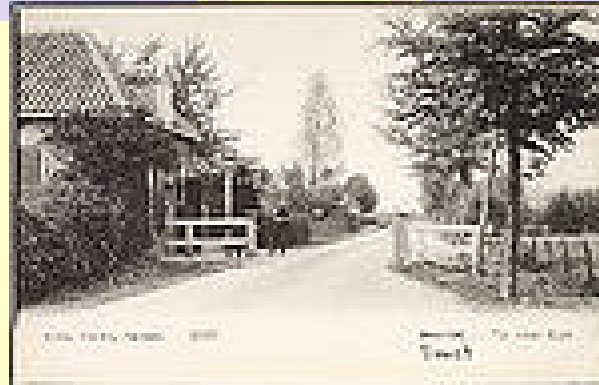
De Tol

In de 21 e eeuw heeft Emst nog steeds een eigen cultureel leven, feesten, een dorps huis, horeca en winkels en is het er goed toeven. Het wachten is nu op een bescheiden nieuwbouw die plaats zal vinden op weer een deeltje van de eeuwenoude Emsterenk, waarop vele voorouders een hun gewassen verbouwd. Hopelijk blijft het eigen karakter nog lang bestaan.