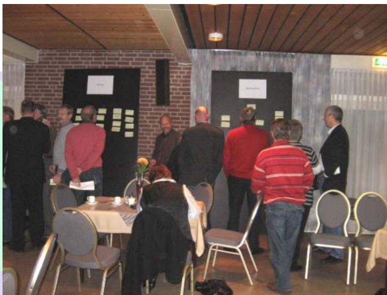
Startbijeenkomst 9 november 2007

Na deze dorpsavond was de DWG druk bezig met de inventarisatie van de ruim 400 aandachtspunten. Dit resulteerde in een speerpuntennota die eind februari 2008 klaar was. In deze nota worden per hoofdonderwerp (voorzieningen, verkeer, woningbouw, recreatie, buitengebied, natuur en milieu, veiligheid en werkgelegenheid en bedrijvigheid) een aantal in eerste instantie belangrijke speerpunten aangegeven. Deze punten zullen met prioriteit in behandeling worden genomen voor nadere uitwerking.