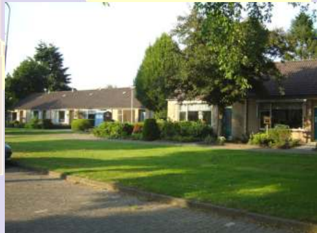
Huidige seniorenwoningen t.o. de Hezebrink

Voor waarborging van een huisartsenpraktijk en andere medische voorzieningen in ons dorp zal gezocht moeten worden naar de mogelijkheid voor een gezondheidscentrum. De huidige dokterspraktijk is te klein en heeft te weinig parkeermogelijkheden. In het gezondheidscentrum zouden ook bijvoorbeeld een tandarts, fysiotherapie, e.d. kunnen worden gehuisvest.