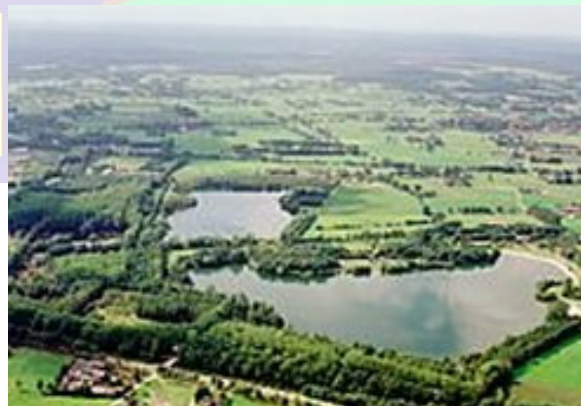
Recreatiegebied het Kievitsveld

van het Apeldoorns Kanaal en initiatiefnemer van deze plannen. De strook tussen de Grift en het Kanaal leent zich uitstekend voor het doortrekken van het fietspad. Een wens is eveneens het doortrekken van het fietspad over de voormalige spoorlijn tussen het Kievitsveld en de Brinkerweg.