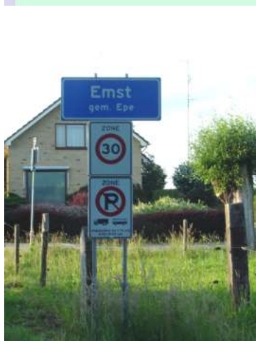
De smalle Stationsweg

Het transformatorhuisje op de hoek van de Oranjeweg/Kerkhofweg belemmert het overzicht op deze kruising. Deze situatie zal door de nieuwbouw verder verslechteren en vraagt eveneens om een oplossing.