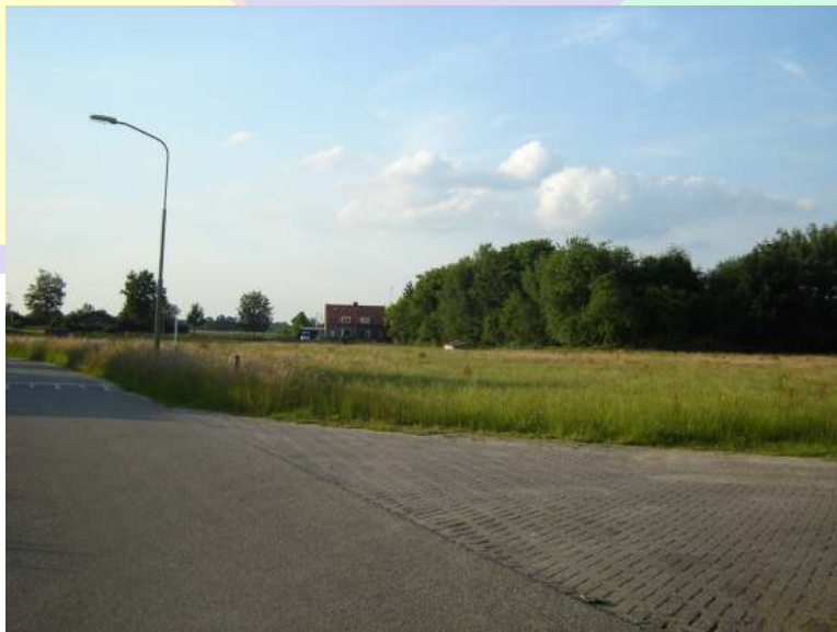
Toekomstige bouwlocatie Kerkhofweg

Hierbij wordt gedacht aan inbreiding in bestaande wijken.