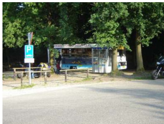
Ijskraam nabij Gortel

Tevens zou dit gebouw een kleinschalig bezoekerscentrum kunnen huisvesten.