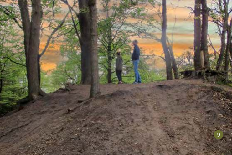
't Bergje in de Hertenkamp. Een fraai gebied met grafheuvels, zwijnen en herten

In totaal is de route ±18 km, de ommetjes niet meegerekend. We hopen dat u zult genieten van al het moois dat Emst langs dit bekenpad te bieden heeft. Meer weten? Er is een luxe Bekenpadgids Emst verkrijgbaar bij de startpunten van de route of via de Bekenstichting. Hierin staan alle bijzonderheden die u tegenkomt uitgebreid beschreven.