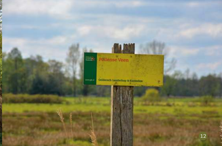
Waterretentiegebied bij de noordtak van de Smallertse Beek