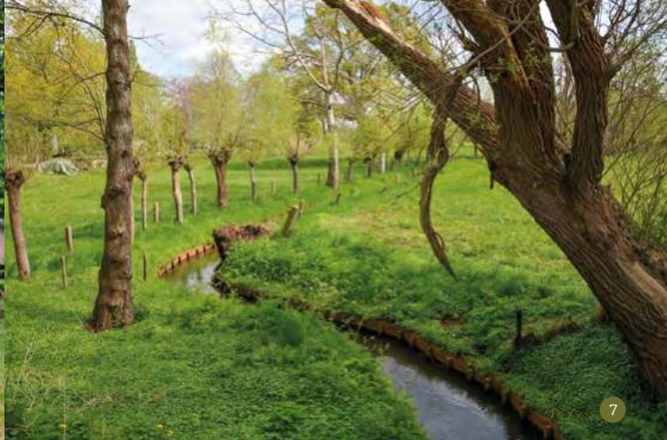
De Smallertse Beek meandert door de weilanden