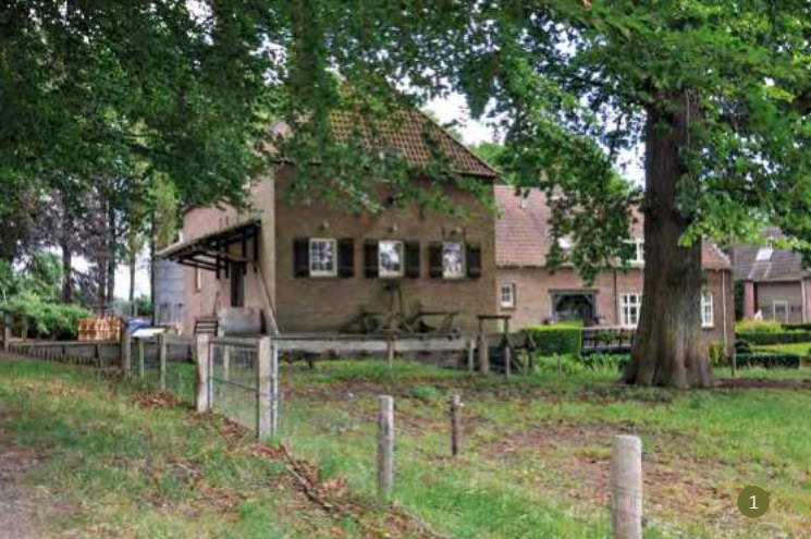
Molenplaats uit 1387. De Cannenburcher watermolen is nog steeds in bedrijf